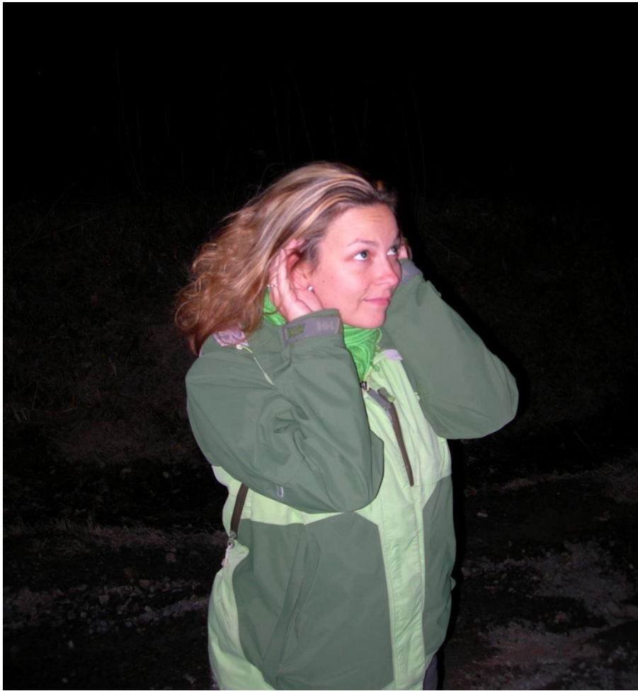
Figure 2. Disposition des mains pour améliorer la perception des chants d'anoures.